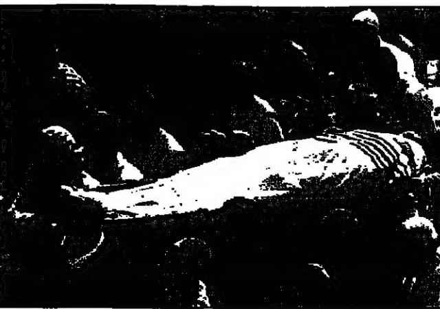
متطفون يهود يشيعون امس الاسرائيلي الذي قتل في القدس الشرقية (الريما)